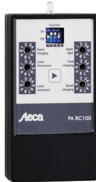
Z02 | 09.44 | DE / EN / ES / FR / IT / PT